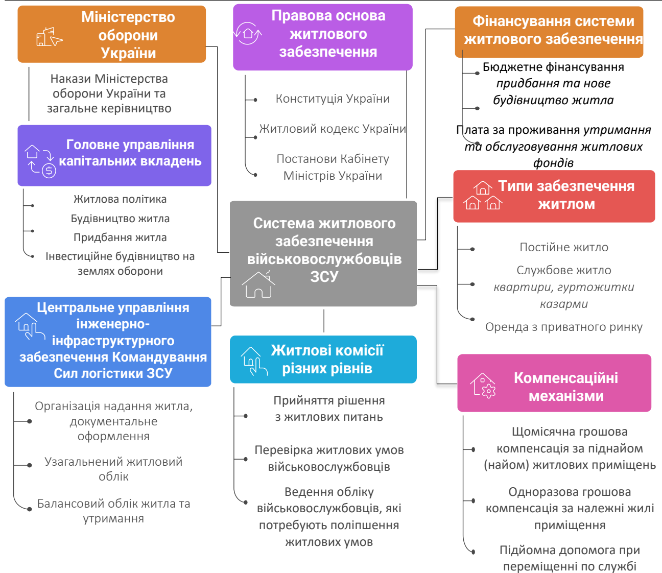
Рисунок 1 – Система житлового забезпечення Збройних Сил України (розробка автора на підставі джерел [10–18])