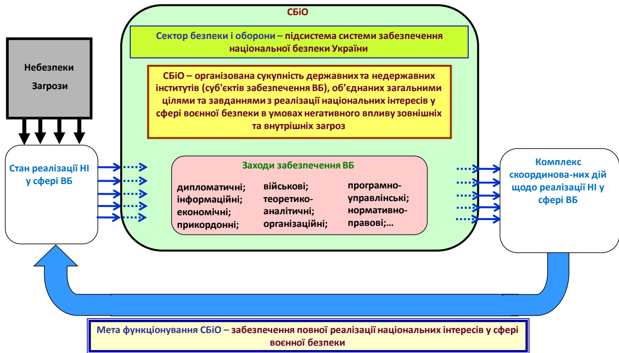
Рисунок 1 – Загальна модель механізму функціонування сектору безпеки і оборони щодо реалізації національних інтересів у сфері воєнної безпеки

Отже, проглядається явне порушення системності державної політики з питань національної безпеки, яке полягає у відсутності єдиного підходу до забезпечення національної безпеки держави – що загрози негативно впливають безпосередньо на національні інтереси. При цьому, саме національні інтереси є первинними, а загрози вторинними. Іншими словами – загрози впливають не на забезпечення безпеки, а безпосередньо на носіїв, зміст та процес реалізації національних інтересів (рис. 1).