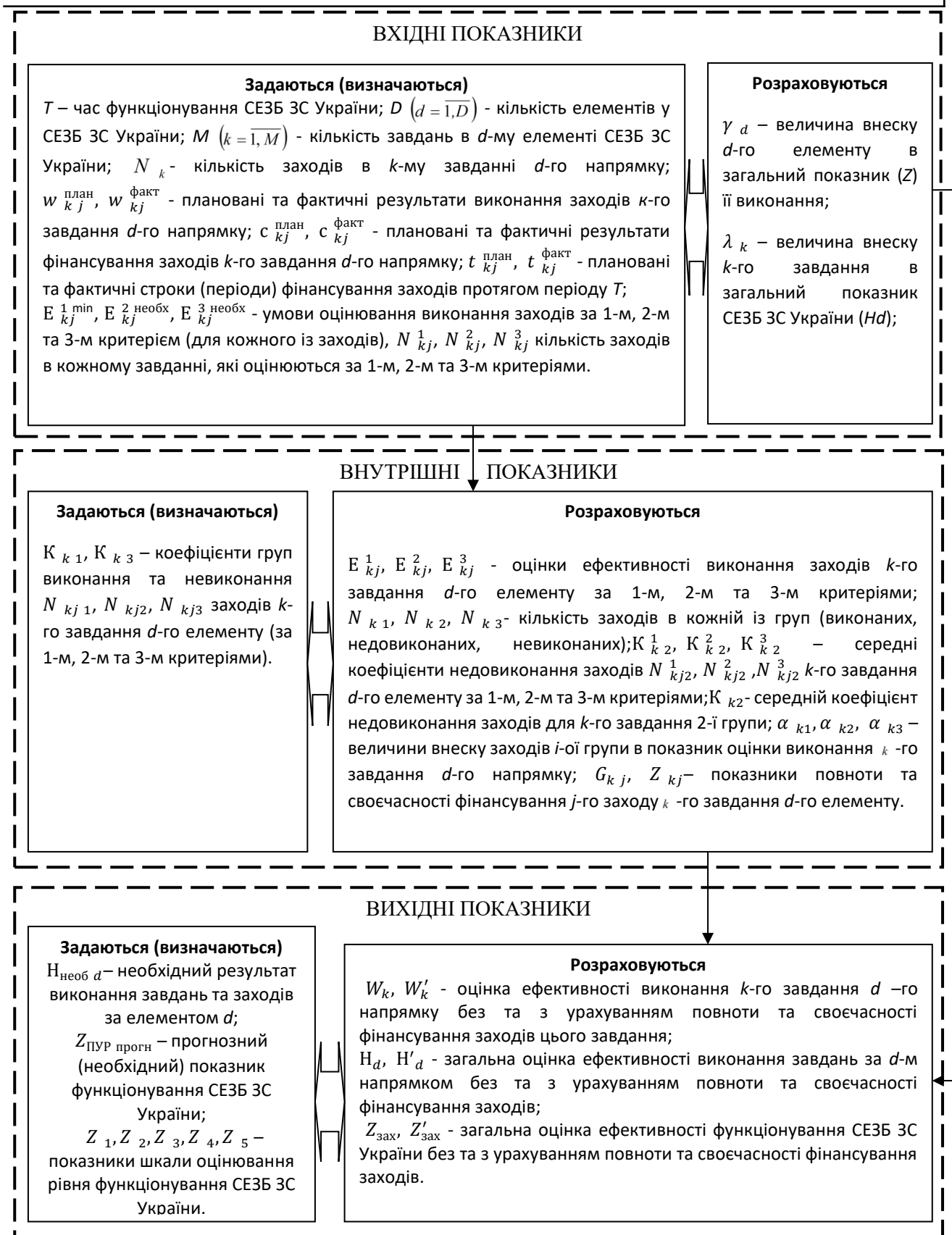
Рисунок 1 – Система показників оцінювання ефективності функціонування СЕЗБ ЗС України