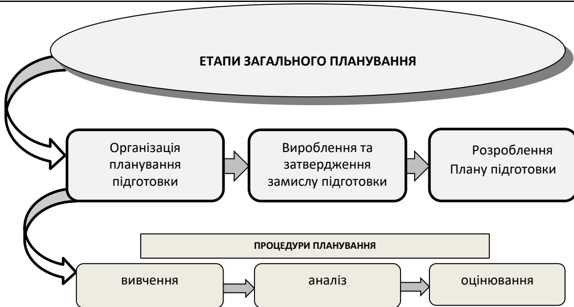
Рисунок 1 – Етапи та процедури загального планування підготовки військ (сил) ОК

Вихідними даними для організації загального планування підготовки військ (сил) ОК є: розпорядження з організації підготовки вищих органів військового управління ЗС України; завдання згідно з оперативними планами застосування військ (сил) ОК; досягнутий рівень злагодженості органу військового управління та військових частин (підрозділів) ОК, (накази з результатами аналізу і оцінювання підготовки); орієнтовні видатки бюджету Міністерства оборони України, що передбачаються для забезпечення потреби на підготовку ОК; накази (розпорядження) командувача військ оперативного командування щодо планування та організації об'єднаної підготовки.