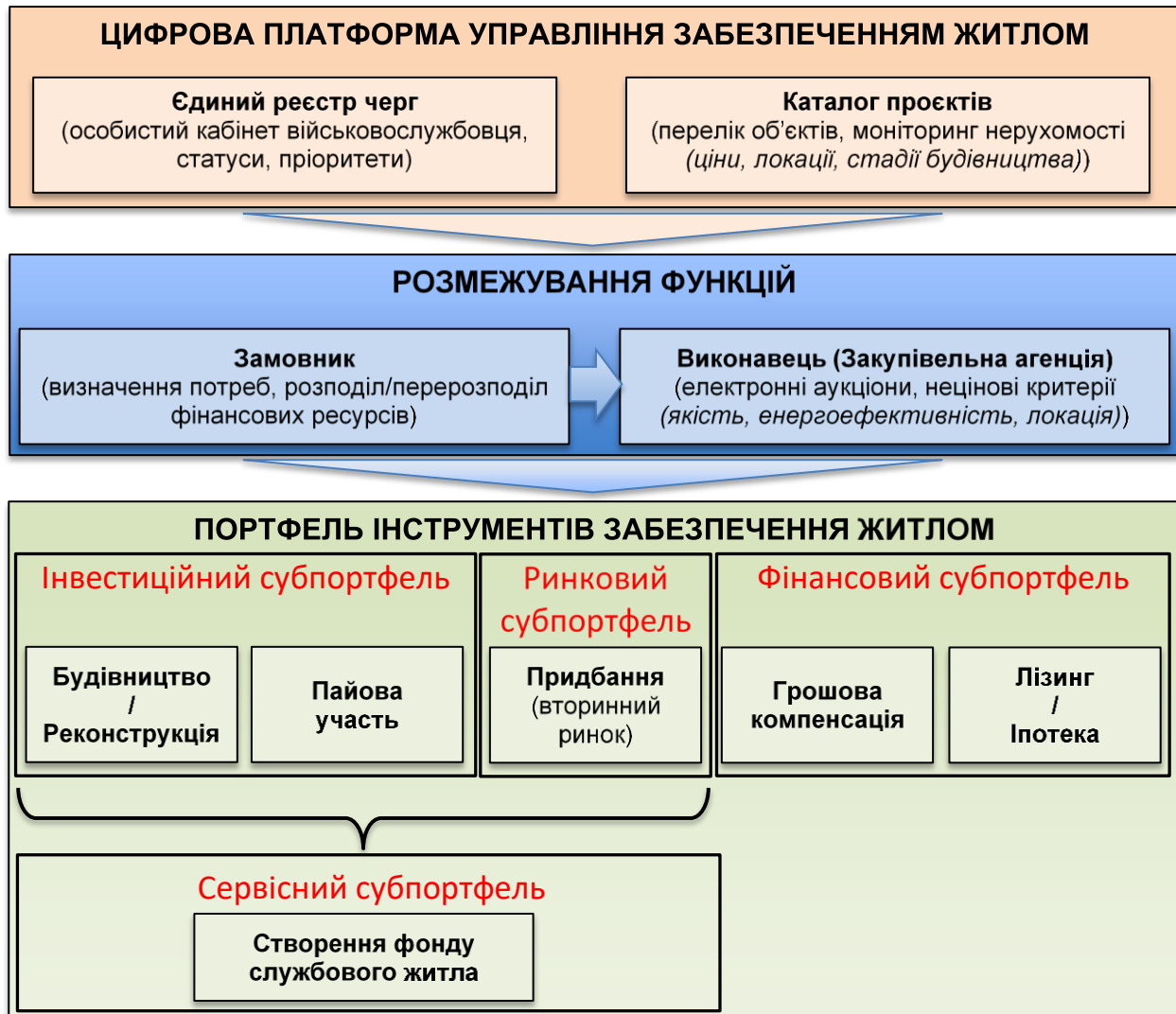
Рисунок 3: Запропонована модель забезпечення житлом військовослужбовців

Схематично систему забезпечення житлом військовослужбовців з урахуванням наданих пропозицій наведено на Рис. 3.